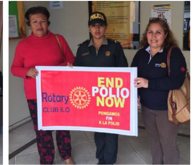
COMISARÍA DE LA CIUDAD DE ILO