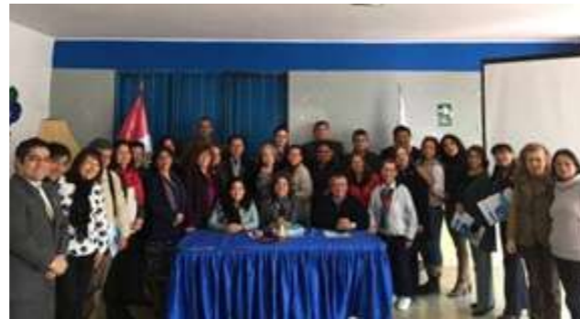
FOTO GRUPAL CON ALGUNOS DE LOS ASISTENTES