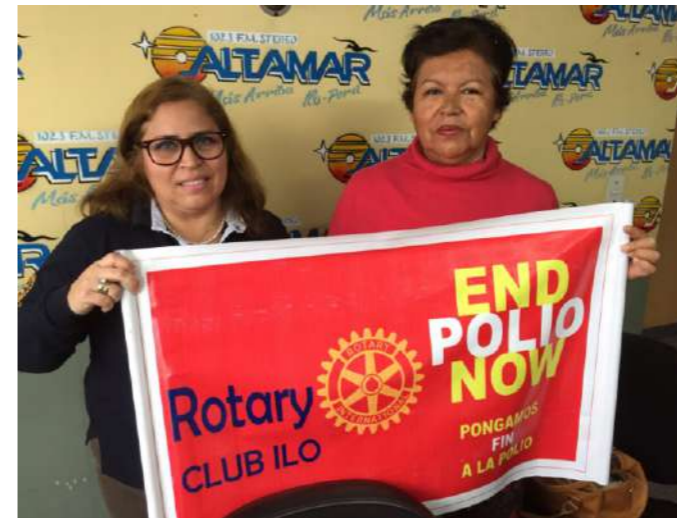
DIFUSIÓN EN RADIO ALTAMAR