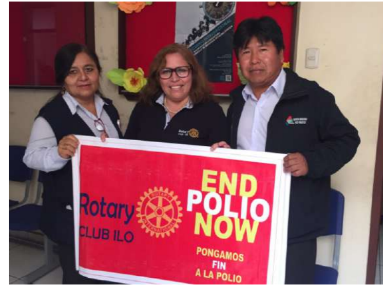
MINSA RED DE SALUD ILO