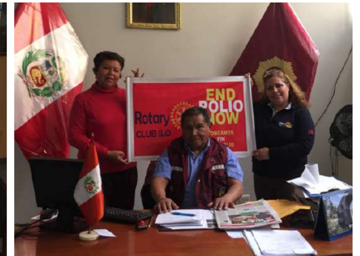
GOBERNADOR DE LA CIUDAD DE ILO